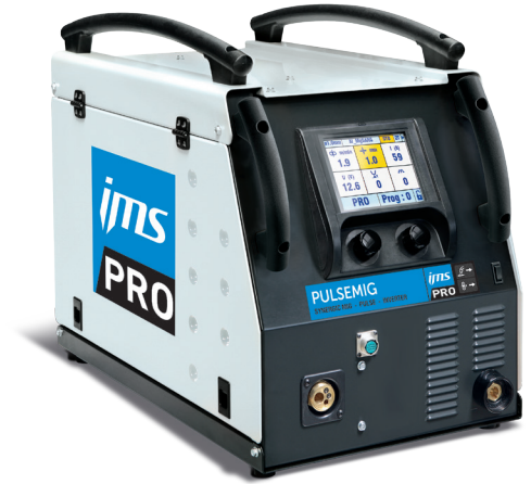
Poste fourni sans accessoires.

Le NEOPULSE détermine les conditions optimales de soudage et permet de les ajuster (vitesse d'avance fil, tension, courant, self).